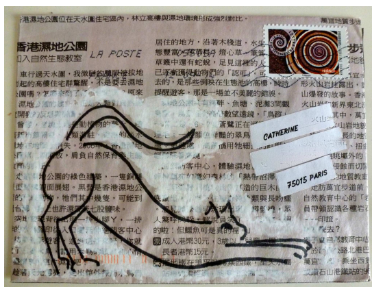
d'une page de journal