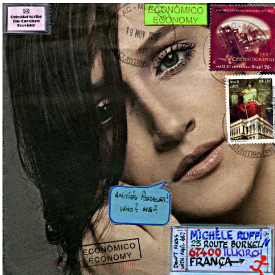
d'une page de magazine