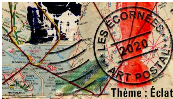
à partir d'une carte routière

Voici quelques exemples trouvés sur internet :