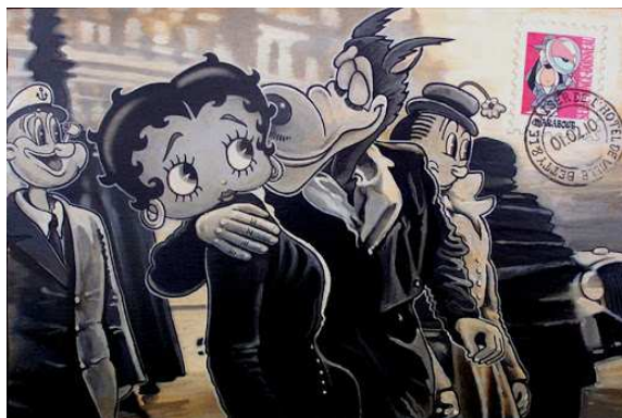
d'une page de magazine